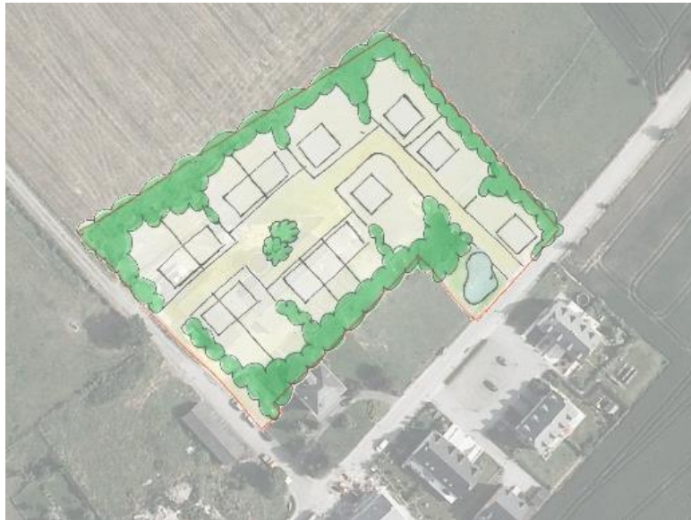
Esquisse de principe